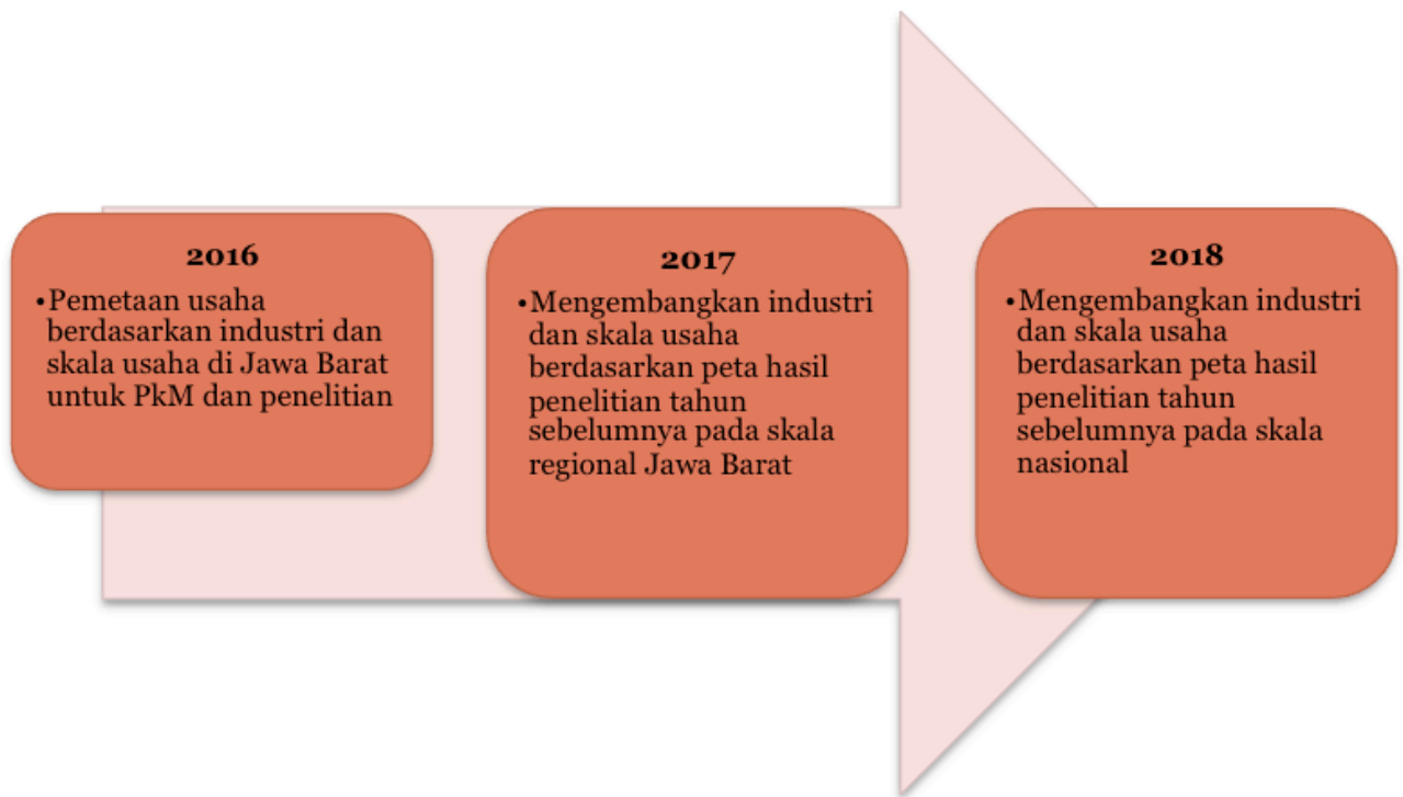
Gambar 2. Roadmap Penelitian KK Business Policy & Strategy periode jangka pendek 2016 - 2018